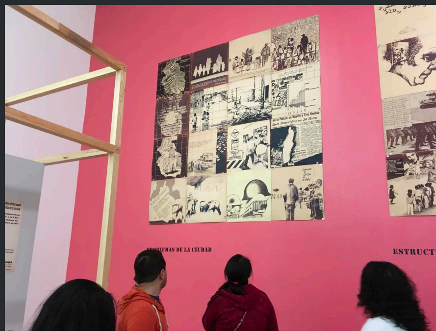
Visitantes a museos entre 2017-2018