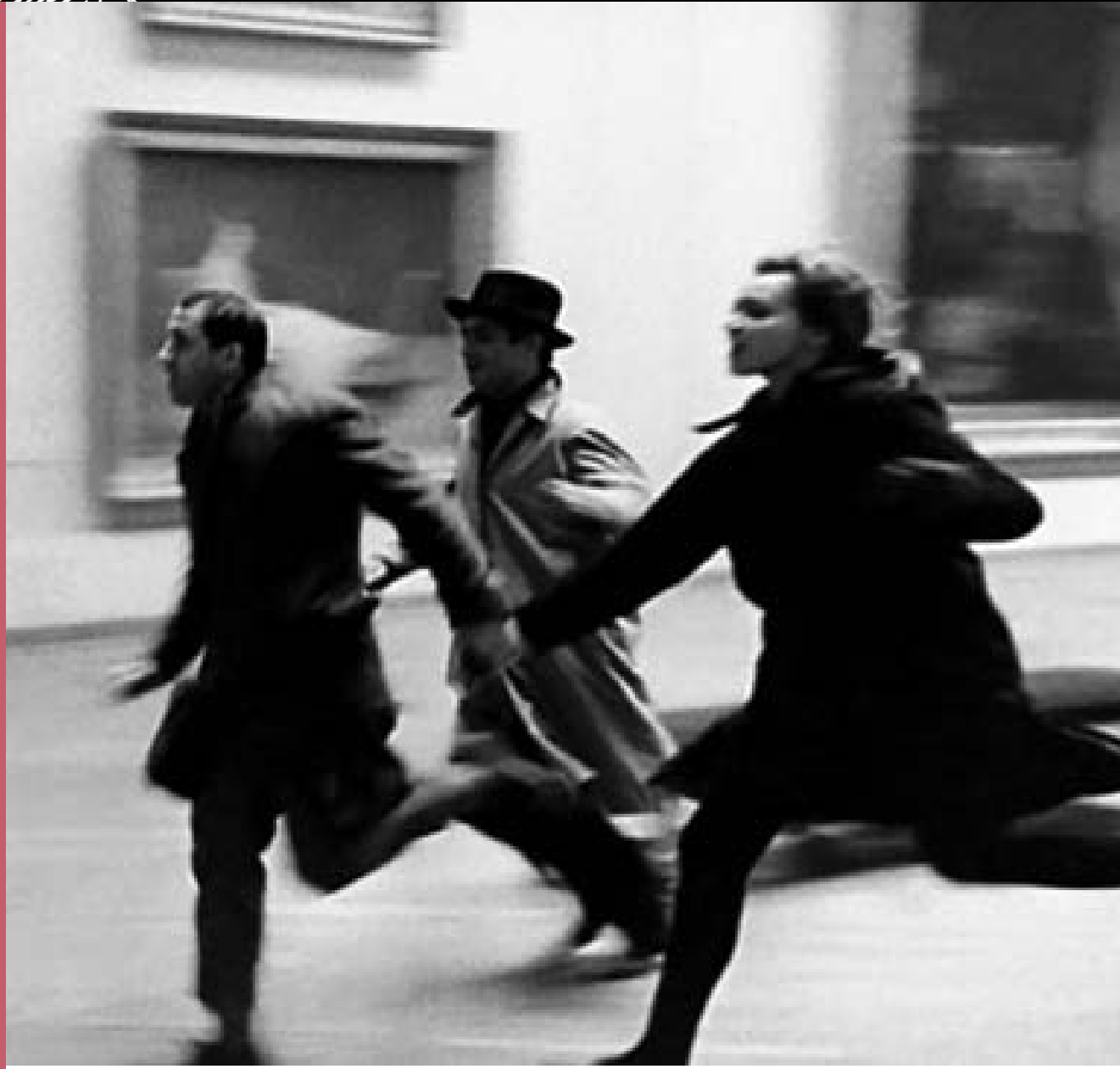
Fragmento de película Band a part , 1963, Jean-Luc Godard

La escena que fue replicada en la película Los soñadores (The Dreamers, 2003) de Bernardo Bertolucci y por el artista Mario García Torres quien realizó un ensayo documental, Una breve historia del legado de Jimmie Johnson (2006), en el que reflexiona sobre el papel de los museos y cómo los visitamos, pudiera tener algo de premonitorio y adelantado a su época, un aviso para todos nosotros: si no cambia la institución museo y se vuelve más accesible no solo en términos de inclusión y diversidad, como un espacio que sea amable para todos, no solamente será una chusca e irreverente escena en una película de la Nouvelle Vague sino una parodia que se repite, con sentido o sin sentido, al recorrer una exposición. Y no importará que la Ciudad de México tenga una oferta cultural comparable con cualquiera de las principales ciudades y fuese reconocida como la segunda ciudad con más museos en el mundo solo después de Londres, bueno ya, Calidad no cantidad -eso dicen, ambas son necesarias.